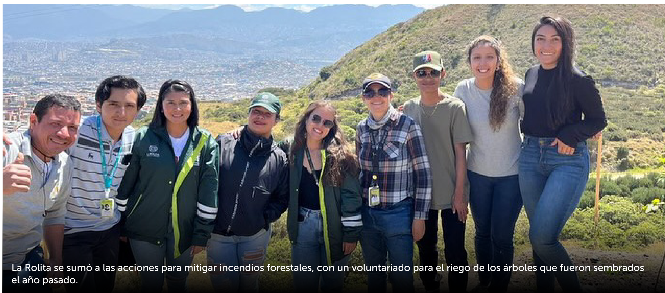
La Rolita se sumó a las acciones para mitigar incendios forestales, con un voluntariado para el riego de los árboles que fueron sembrados el año pasado.

Este trabajo conjunto ha permitido identificar problemáticas como la mala disposición de residuos