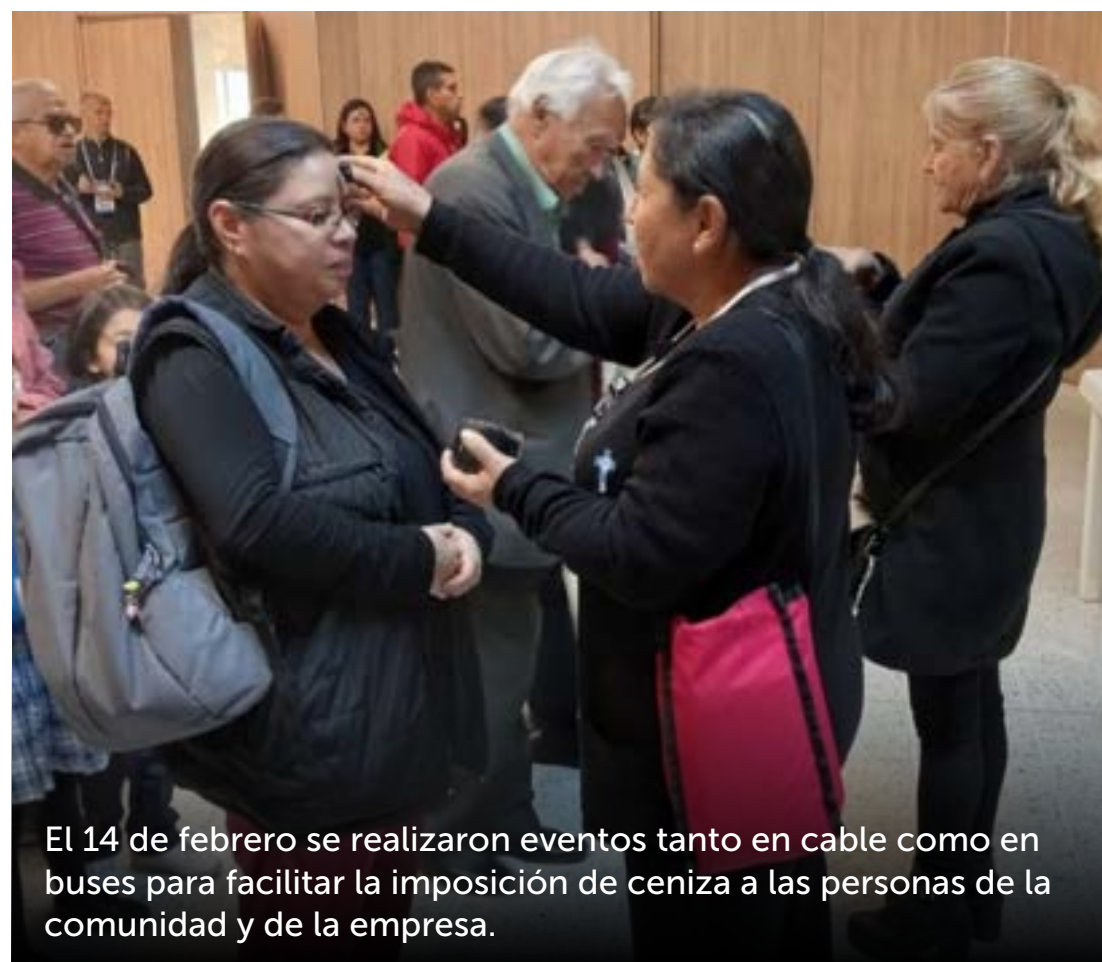
El 14 de febrero se realizaron eventos tanto en cable como en buses para facilitar la imposición de ceniza a las personas de la comunidad y de la empresa.

La Rolita también ha desplegado una estrategia con las comunidades de la zona de influencia del cable para mantener la relación de armonía que existe entre el Sistema y sus usuarios, afianzando lazos a través de reuniones comunitarias y planes de trabajo mancomunados que buscan alcanzar objetivos de interés social para estas personas.