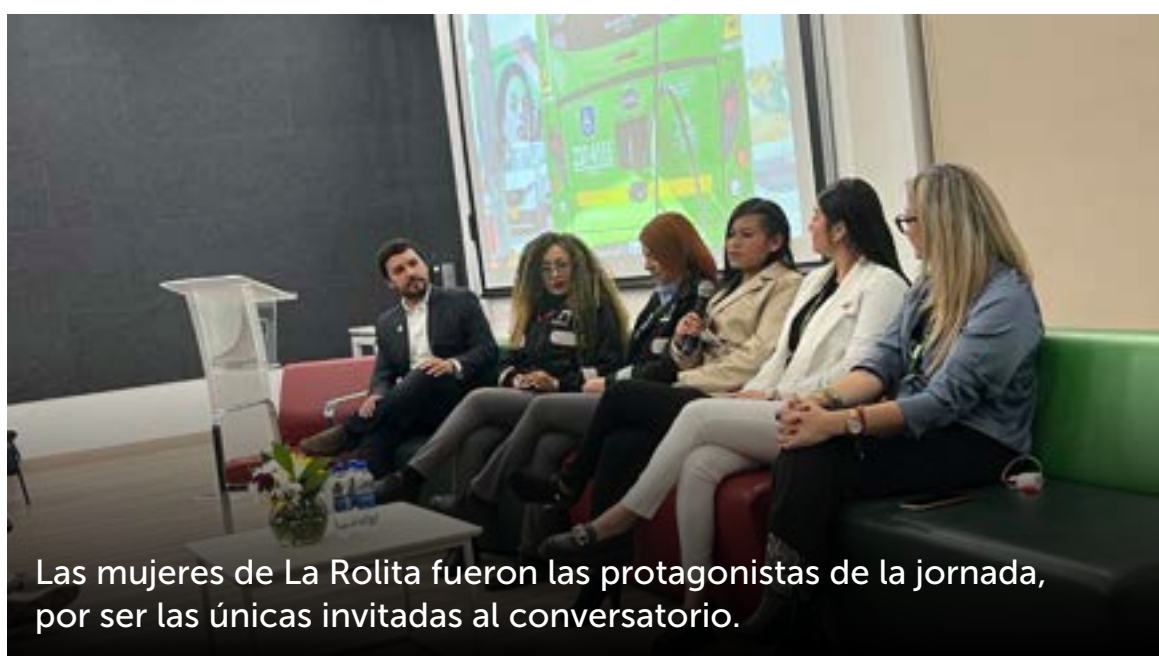
Las mujeres de La Rolita fueron las protagonistas de la jornada, por ser las únicas invitadas al conversatorio.

Así mismo, contó que se han recibido alrededor de 300 visitas de delegaciones de otras ciudades de Colombia y también de la academia.