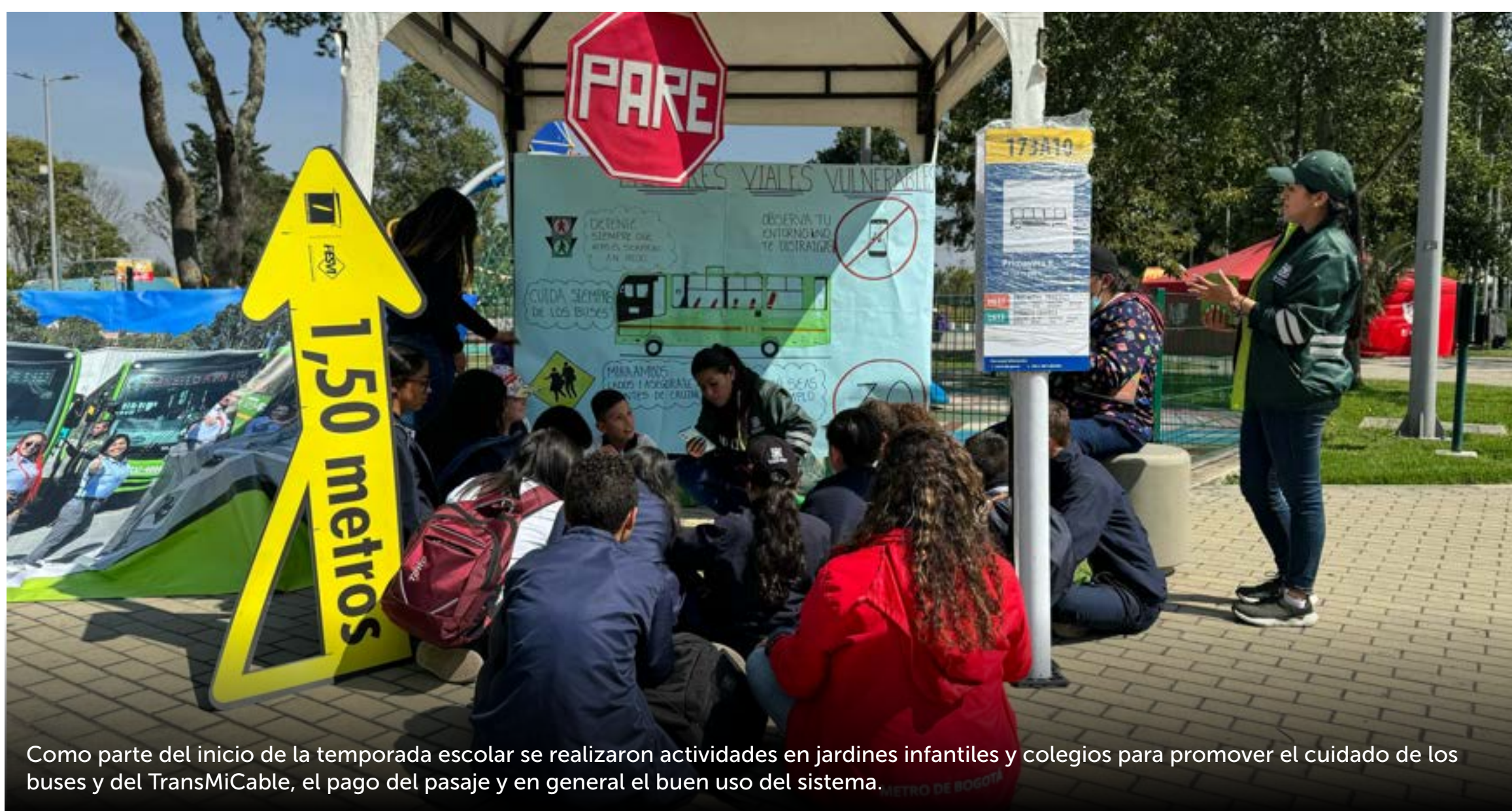
Como parte del inicio de la temporada escolar se realizaron actividades en jardines infantiles y colegios para promover el cuidado de los buses y del TransMiCable, el pago del pasaje y en general el buen uso del sistema.